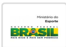
Brasil - Ministério do esporte