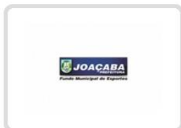
Fundação Municipal de Cultura e Esporte