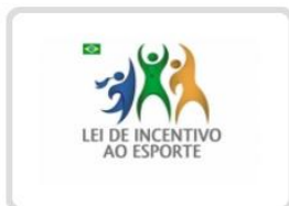
Brasil - Lei do incentivo ao esporte